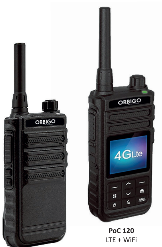
PoC 100 LTE

Kontakta Orbigo eller din ÅF för offert och förslag! www.orbigo.se